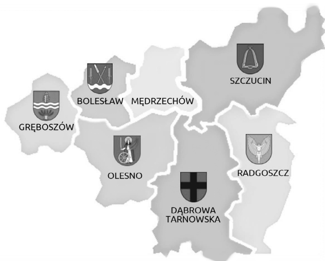
Rysunek 3.1. Gminy powiatu dąbrowskiego

Zgodnie z wyliczeniami wielkość próby wyniosła (w przybliżeniu) 593 respondentów. W dalszej kolejności dokonano podziału kwotowego według miejsca zamieszkania, płci oraz wieku, aby uzyskać reprezentatywność próby 234 . Na rysunku 3.1 przedstawiono w zarysie powiat dąbrowski z podziałem na gminy.